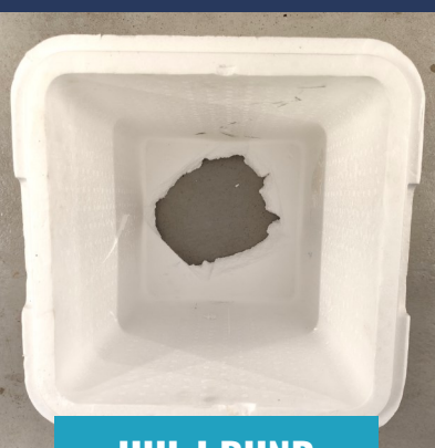
HUL I BUND