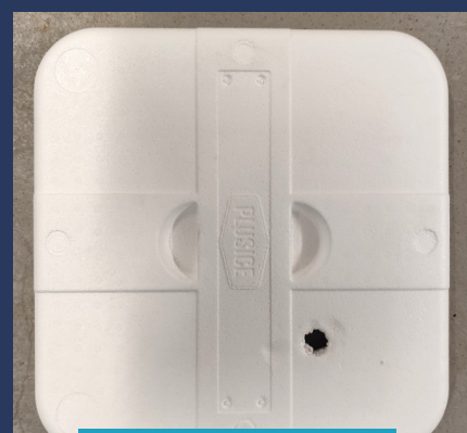
HUL I LÅG